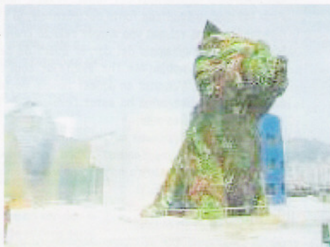
Foto: Entrada al Museu Guggenheim

El 26 de setembre anirem a Perpinyà i podrem visitar el que fou el Castell dels Reis de Mallorca i el museu d'art popular de Castellet. Aprofitarem també per aturar-nos a Elna i visitar el claustre romànic de l'abadia, que és el més ben conservat del les dues Catalunyaes. Dinarem a Cotlliure, i visitarem aquest encantador poble de costa on està enterrat el poeta Antonio Machado.